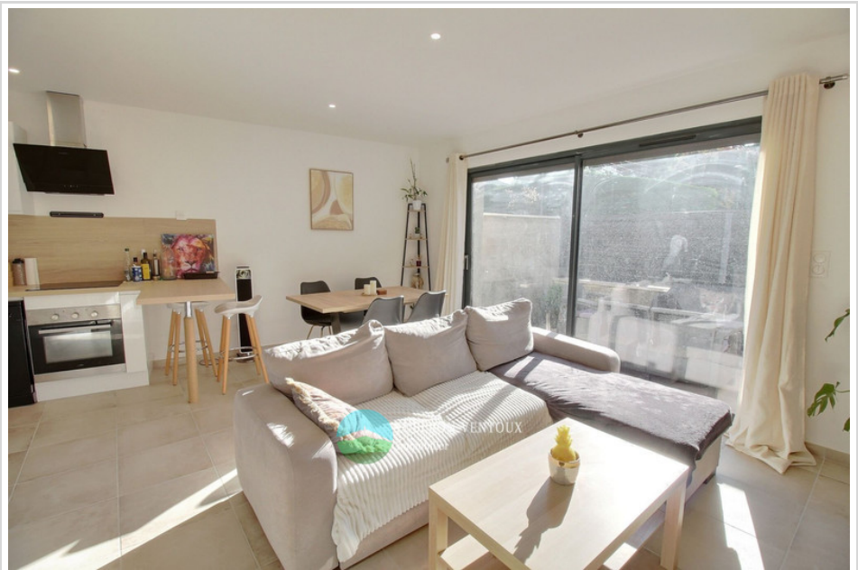
Maison 30803 Robion

Honoraires à la charge du vendeur, aucune procédure en cours, les informations sur les risques auxquels ce bien est exposé sont disponibles sur georisques.gouv.fr