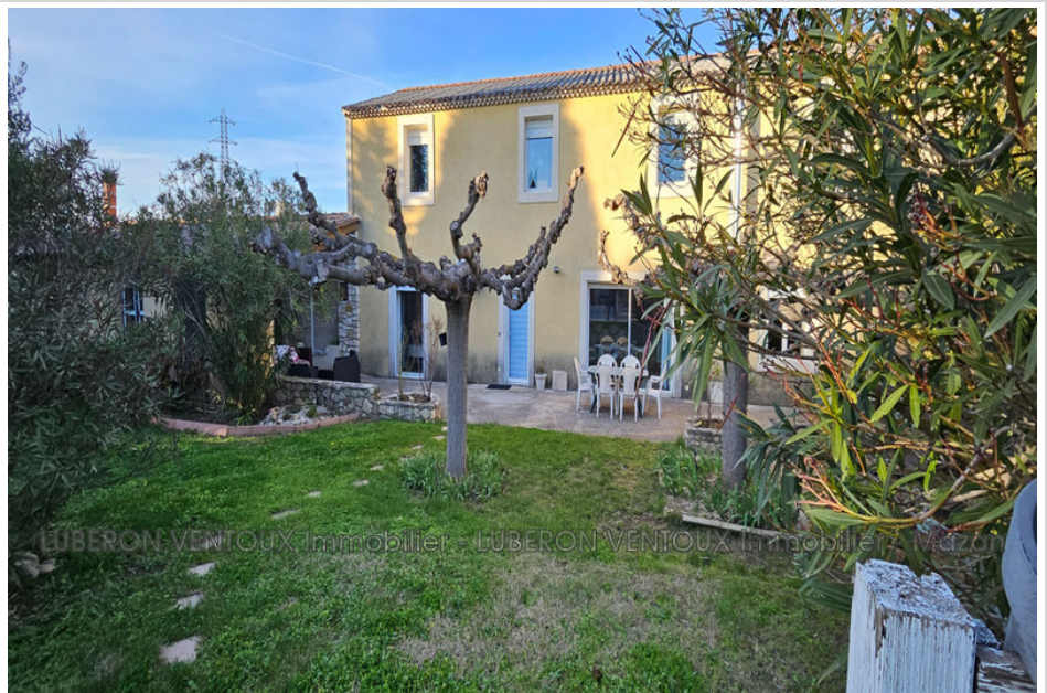
Mas 30815 Carpentras

fees included no current procedure, information on the risks to which this property is exposed is available on georisques.gouv.fr