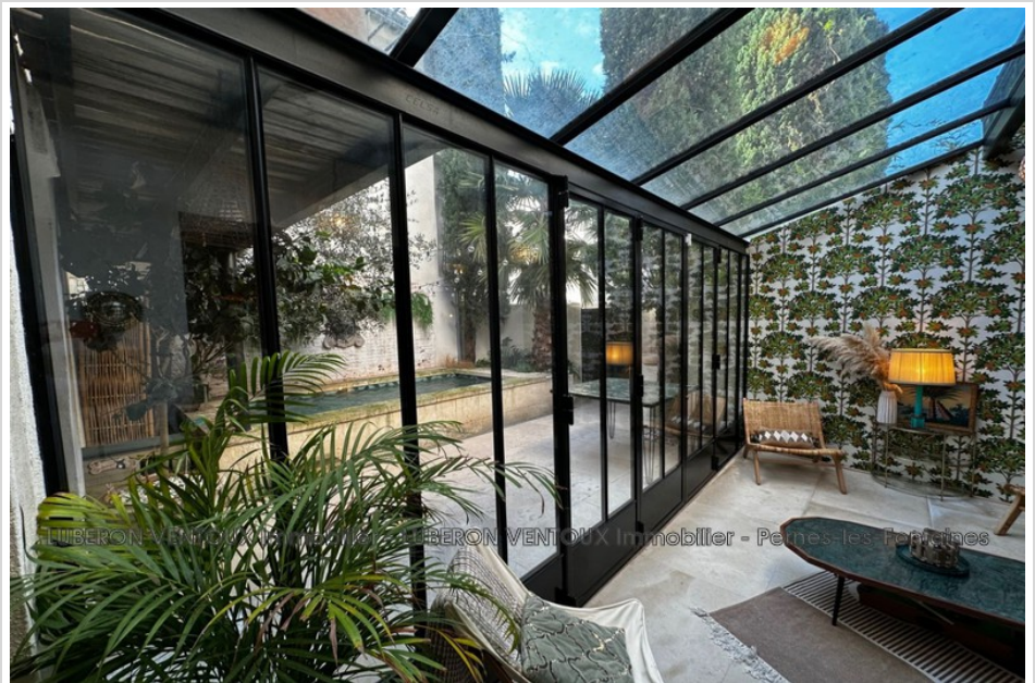
Maison de village 50479 Maillane

fees included no current procedure, information on the risks to which this property is exposed is available on georisques.gouv.fr