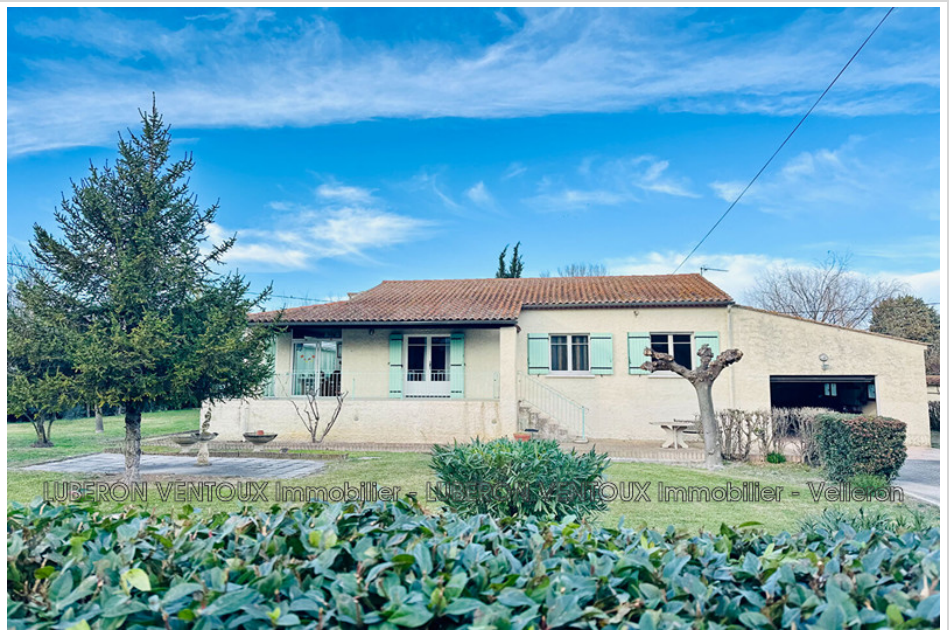
House 30811 Le Thor

fees included no current procedure, information on the risks to which this property is exposed is available on georisques.gouv.fr